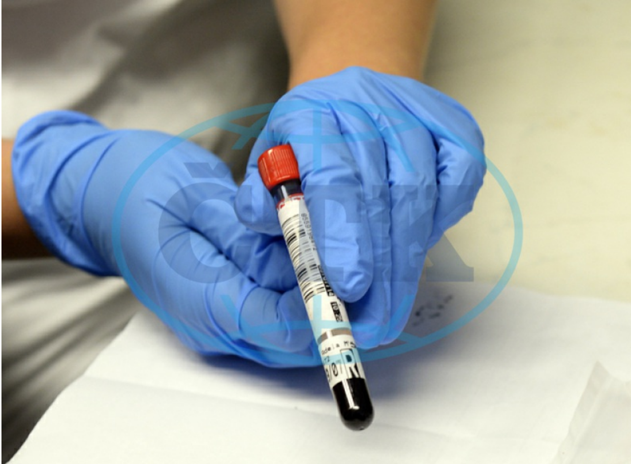
Odběr krve, biochemická laboratoř, ampule s krví, nemocnice

Praha - Nový test z krve odhalí včas ohrožení těhotné ženy i plodu preeklampsii, kdy placenta nefunguje správně, takže plod nemá dost kyslíku a živin. Preeklampsie patří k nejčastějším příčinám úmrtí v těhotenství. Je to nebezpečné onemocnění, které bývá obtížné odhalit včas, protože příznaky jako vysoký tlak, otoky nohou, bolesti hlavy a nevolnost se mohou objevit i při normálním těhotenství.